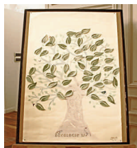
La Soirée Bien-être & Cancer